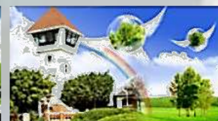
低炭素グリーンエネルギー永続大台南