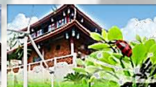
新農業新農村新農人