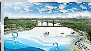
水に親しむ大台南