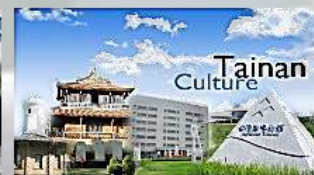
文化首都創意城市