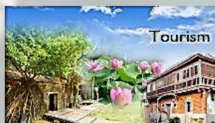
魅力都会と田舎の観光楽園