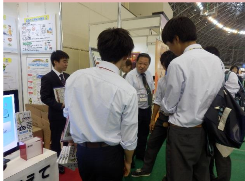
10/21(金)パネル展示説明風景